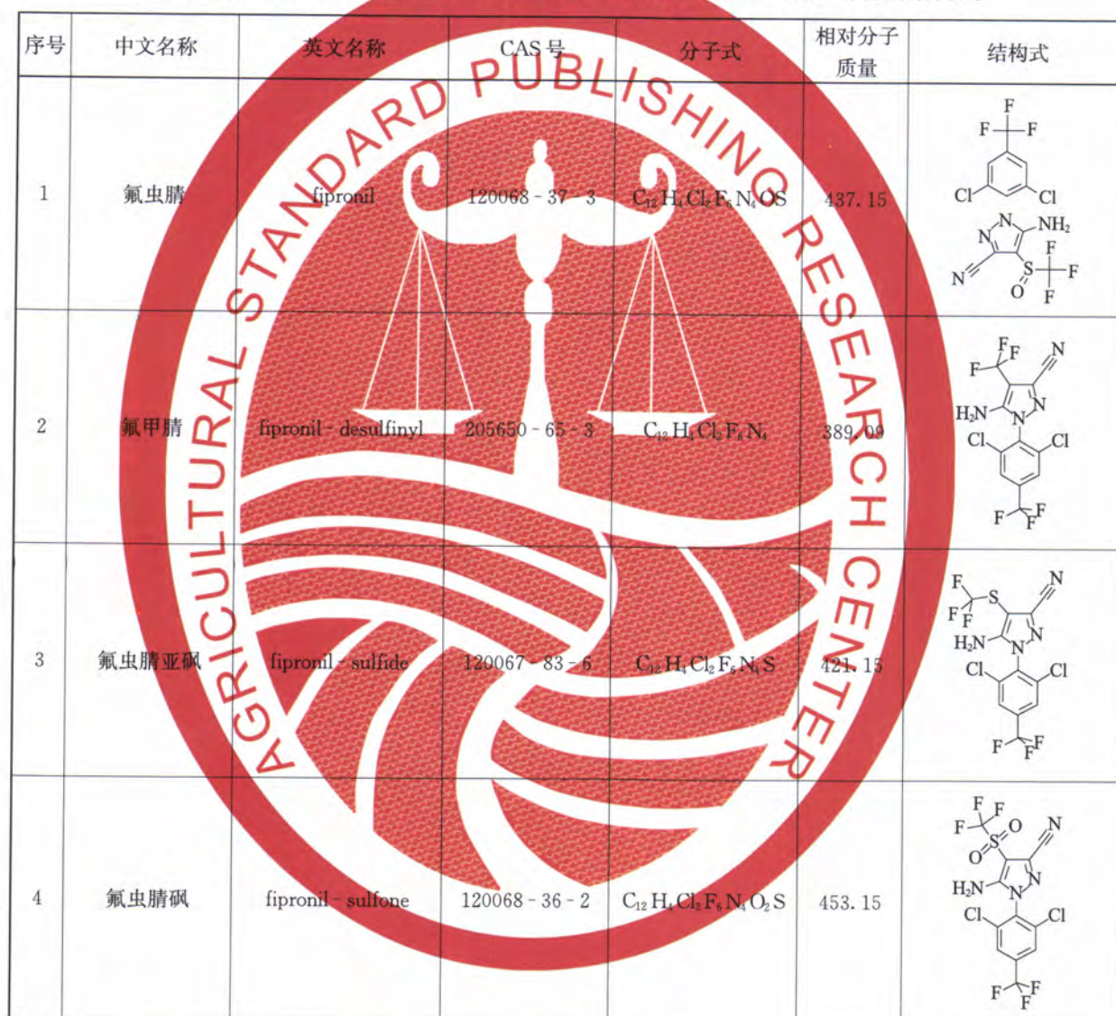
表 A.1 化合物中文名称、英文名称、CAS 号、分子式、相对分子质量、结构式